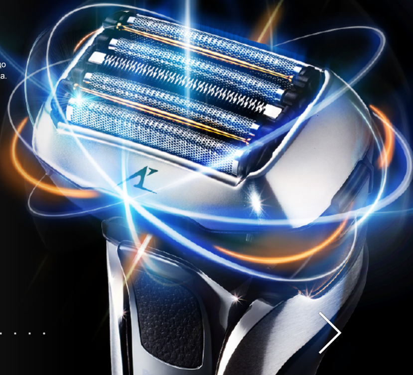
Вперед и назад