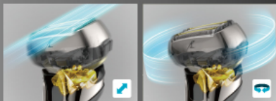
Скольжение вперед и назад Вращение

Новая конструкция механизма подвески расширяет возможности движения головки до пяти пространственных измерений. Гибкая головка точнее следует за контурами лица. Более тесный контакт для более гладкого бритья.